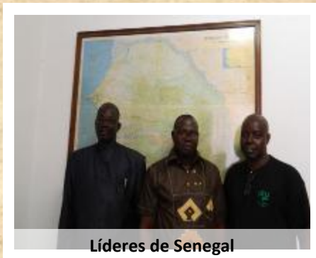
Líderes de Senegal